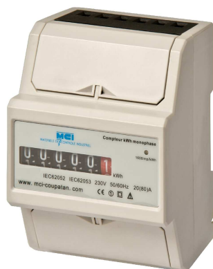
Affichage mécanique ref MCI : 031043

compteur totalisateur de kWh - réseau monophasé - branchement direct fixation modulaire - livré avec caches-bornes plombables