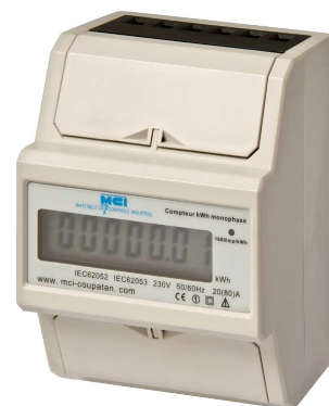
Affichage LCD ref MCI : 031041